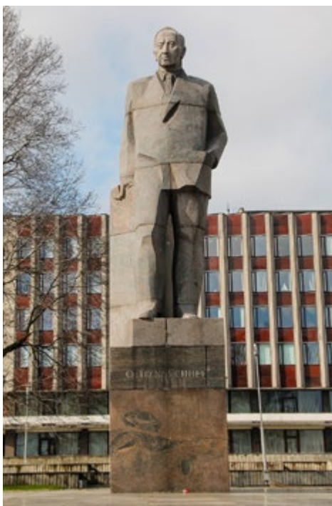
Памятник Отто Куусинену в Петрозаводске

зультате целый ряд профессионалов лишился работы. Были резко сокращены штаты органов госбезопасности. Руководители КГБ оказались генералами без армии. Ликвидировались районные отделы КГБ и первые отделы на заводах, фабриках, в учреждениях и учебных заведениях. Органам КГБ было запрещено собирать компромат на партийных работников начиная с уровня секретаря райкома.