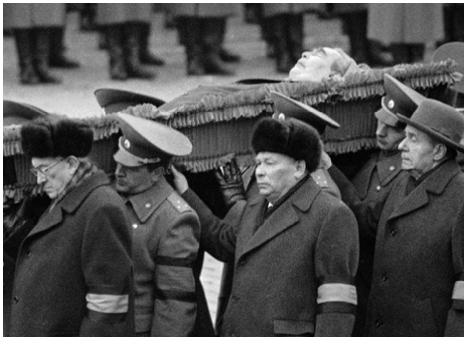
Похороны Леонида Брежнева. Гроб с телом несут Юрий Андропов, Константин Черненко и Андрей Громыко (слева направо). 15 ноября 1982 года